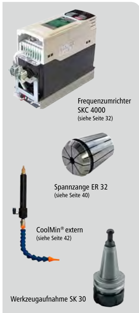
Frequenzumrichter SKC 4000 (siehe Seite 32)